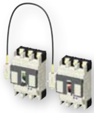
Žična mehanička blokada