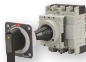
Produžena okretna ručica prekidača (montaža na vrata panela - blokada vrata)