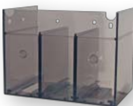
Zaštitni poklopci stezaljki