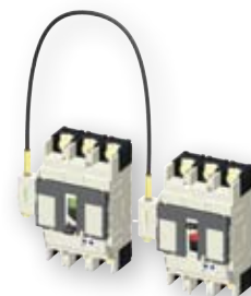
žična mehanička blokada

Okretna ručica prekidača može se blokirati sa bravom u položaju OFF.