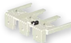
Zaštitni poklopci stezaljki, izvlačivi priklj.