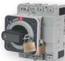
Direktna okretna ručica prekidača