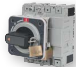
Direktna okretna ručica prekidača

Okretna ručica prekidača može se blokirati sa bravom u položaju OFF.