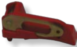
Mehanizam za blokadu