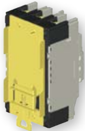
Adapter za montažu na DIN letvu